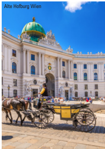
Alte Hofburg Wien

Hinweise: Gültiger Personalausweis oder Reisepass erforderlich. Sonstige Eintrittsgelder sowie Ortstaxe sind nicht im Reisepreis enthalten. MTZ: 25 bei einer Absagefrist bis 4 Wochen vor Reisebeginn.